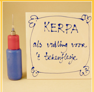
superklebend Engobe, Füllung für Zeichenflasche *