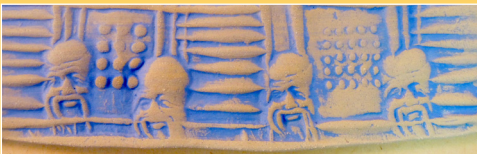
einwaschen von Farben in rohgebranntes Relief *