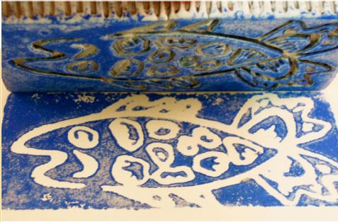
Stempeldruck auf trocken oder rohgebranntem Ton *

Stempel, Tampondruck, Reispapiertransfer, übertrag Drucktechniken. Entdecken Sie neue Möglichkeiten... stellen Sie Ihre eigene farbige - Keramiktinte her!