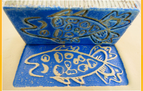
Stempeldruck/Reliefdruck in weichen Ton *