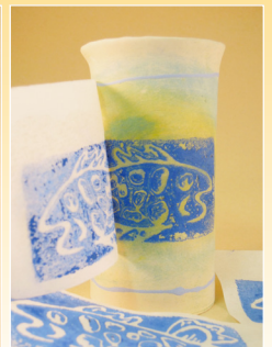
Stempeln von Reispapiertransfers **